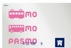
知的障がい者（本人）用のPASMO