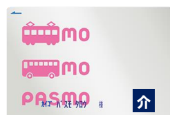
身体障がい者の介護者用のPASMO