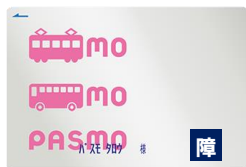
身体障がい者（本人）用のPASMO