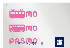
知的障がい者の介護者用のPASMO

※定期券としても利用することが可能です。ただし、搭載可能な定期券は、障害者用割引定期券のみとなり、一部の事業者を除き、本人用と介護者用セットで発売となります。 定期券の種類や発売箇所等の詳細は、ご利用になる定期券発行事業者におたずねください。