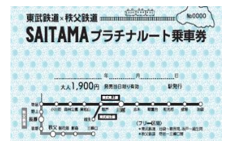
△秩父鉄道発行乗車券（イメージ）

※鉄道に関するお問い合わせ先 東武鉄道お客さまセンター TEL03-5962-0102 秩父鉄道お問い合わせ先 TEL048-580-6363