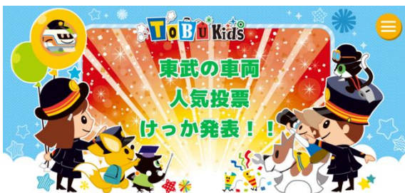
▲TOBU Kids トップページ

小学生をメインターゲットとし、参加・体験型のサイトを運営しています。親子でお楽しみいただける様々なコンテンツを展開しているほか、参加者を募集しての体験イベントを開催するなど、東武グループ各社と連携した“東武グループのキッズサイト”として、多くのお客様にお楽しみいただいています。