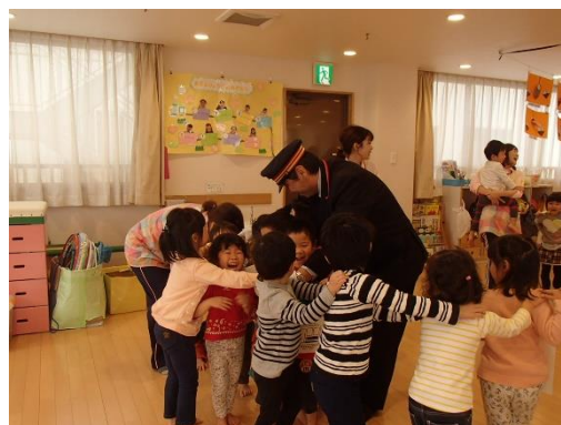
▲保育施設でのイベントの様子