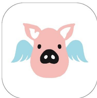
▲TOBU POINT アプリアイコン