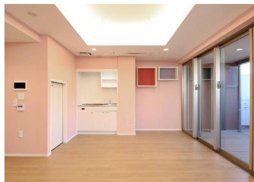
▲ソライエアイル練馬北町（キッズルーム）