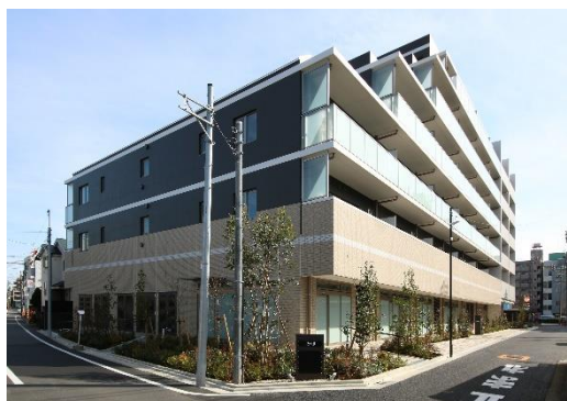
▲ソライエアイル練馬北町（外観）

東京都練馬区内に2020年1月に竣工した賃貸マンション「ソライエアイル練馬北町」は、東武鉄道として初めて「東京都子育て支援住宅認定制度」の認定を取得しました。本物件では、ドアの指はさみ防止やベビーカー置き場、動線や広さに配慮した間取りを取り入れ、入居者にベビーシッターサービスの無料枠を提供するほか、共用部にキッズルームを設置し、子育てしやすい環境づくりを行っています。