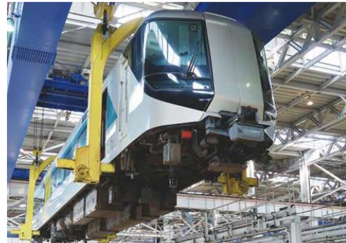
▲南栗橋工場見学プログラム（イメージ）