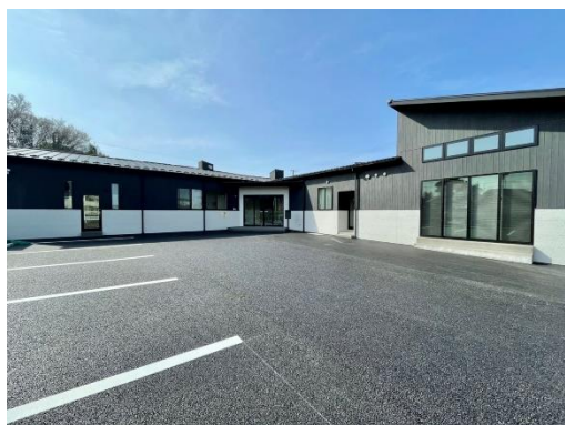
▲しみず空と杜の保育園

働く子育て世代を支援するため、沿線の当社保有地に保育施設・学童保育室の誘致を進めています。2022年4月には東武アーバンパークライン 清水公園駅前に認可保育所「しみず空と杜の保育園」を開設し、駅チカ保育所は合計18施設、学童保育室は合計2施設となりました。