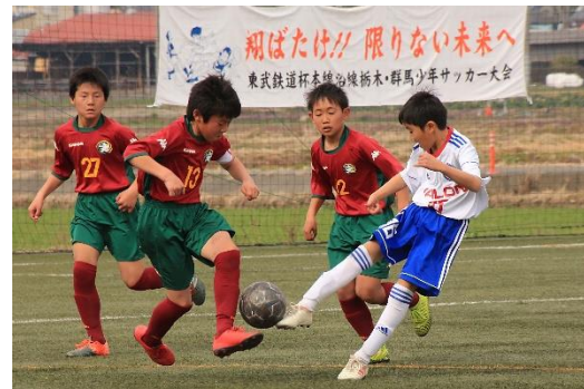
▲少年サッカー大会