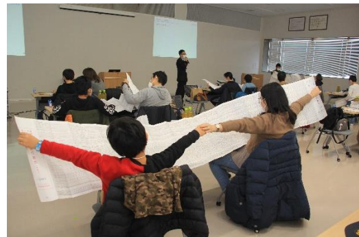
▲親子で学ぼう！東武鉄道ダイヤ作成教室