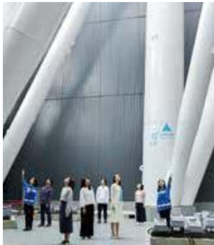
▲東京スカイツリー®構造ガイドツアー（イメージ）

学校授業の一環として社会学習を行う小学生、中学生、高校生の学生団体を対象に、社会に不可欠なインフラである鉄道や東京スカイツリーについて、実地体験として学んでいただく機会を創出することで、学校教育充実に貢献するとともに、東武沿線に対して愛着や誇りを感じていただくことを目的として実施しています。