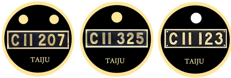
△缶バッジ（イメージ）