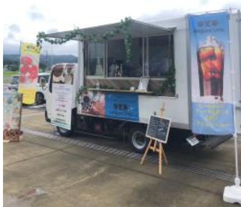
△キッチンカー(イメージ)