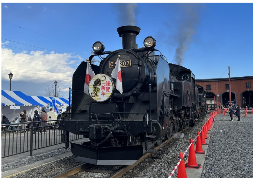
△昨年のSLファンフェスタの様子