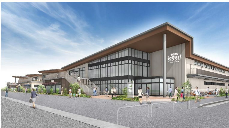
△建物イメージパース