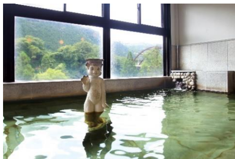
△水沼駅温泉センター