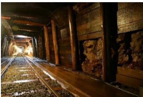
△足尾銅山観光（坑内イメージ）

バスの利用方法や特典・おすすめルートの詳細については、特設サイトをご覧ください。