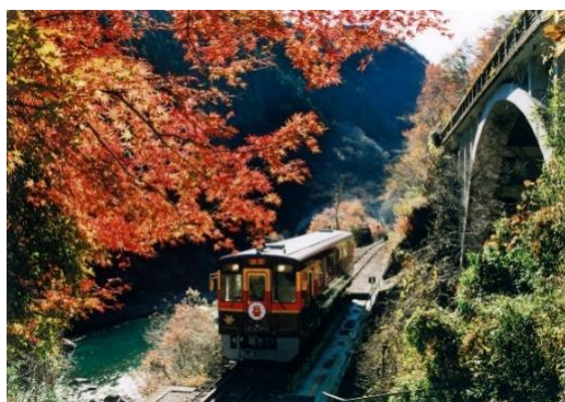
△わたらせ渓谷鐵道