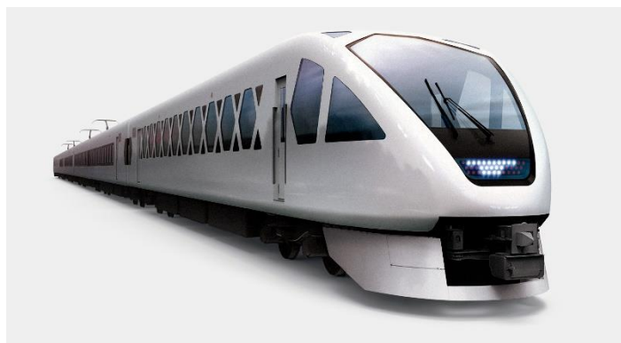
△スペーシア X (外観イメージ)

鉄道がつなぐ物理的なつながりに留まらず、様々な情報やサービスを更新し提供することで、車両に乗り込んだ瞬間から、お客様それぞれにとって「自分だけの最適な日光・鬼怒川エリア」へとつながることができ、幾度も同エリアを訪れたいくなる特急を目指します。