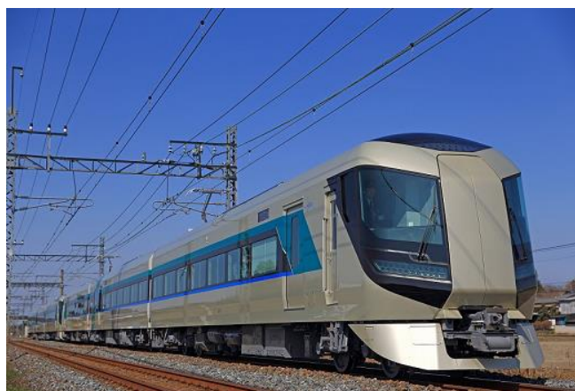
△リバティりょうもう