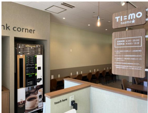
▲ 「TI=MO（ティーモ）」イメージ