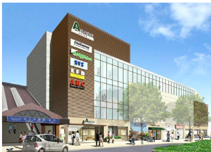
△完成イメージパース