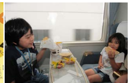
△特急スペーシア車内限定お弁当「GOOD LUCK CURRY BURGER」