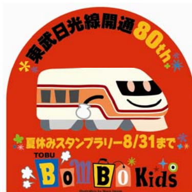
△ヘッドマークデザイン 左から「男の子」「女の子」「電車」