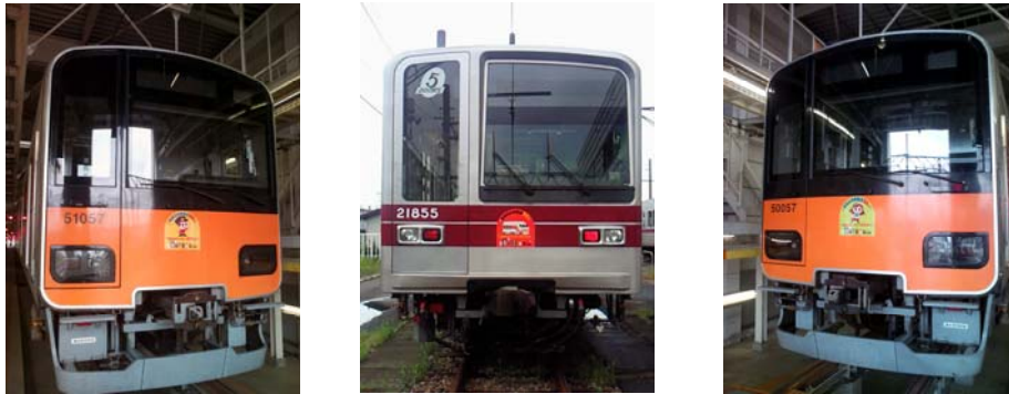
△東武キッズサイト“TOBU BomBo Kids”ヘッドマーク列車