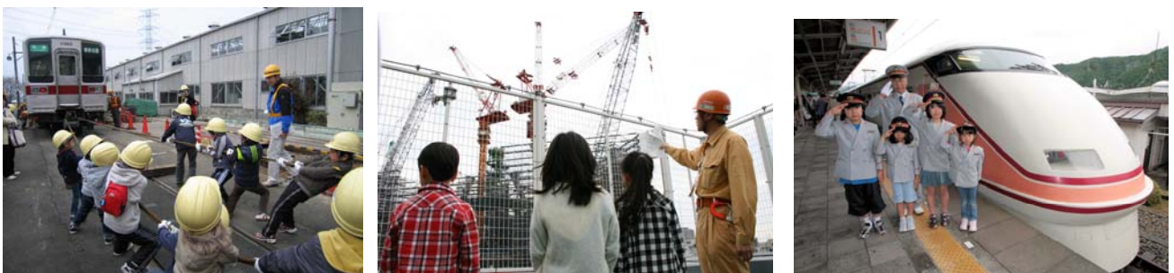
△東武キッズサイトイベントの様子

参加・体験型サイトとして、小学生とご家族の方を当サイト上で募集し、これまでに“電車で綱引き”や“東武動物公園の裏側探検”、“東京スカイツリー学習会”、“お仕事体験”などに親子で参加いただき、その楽しい様子をサイト上で公開しています。