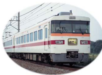
△日光線特急「しもつけ号」