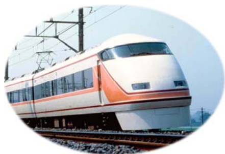
△日光線特急「スペーシア」