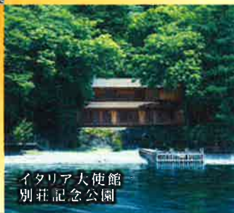
イタリア大使館 別荘記念公園