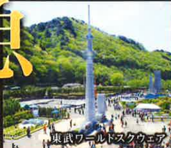
東武ワールドスクウェア