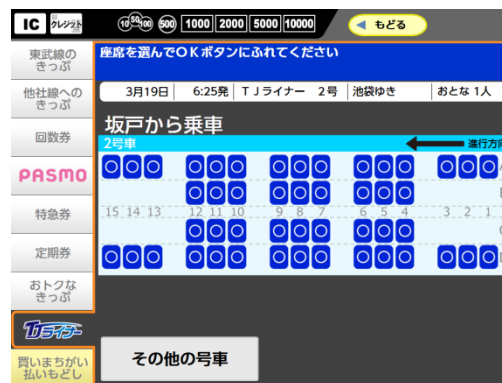
△自動券売機の座席指定選択画面（イメージ）