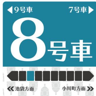
△川越デザイン (時の鐘)