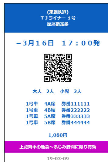
△ネット座席指定券画面(イメージ)