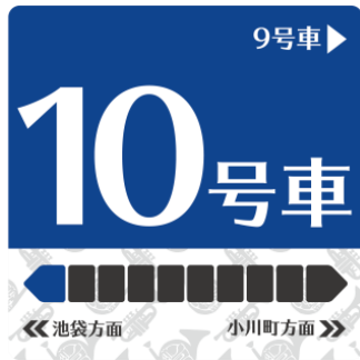
△池袋デザイン (芸術)