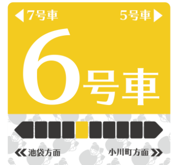
△坂戸デザイン (よさこい祭)