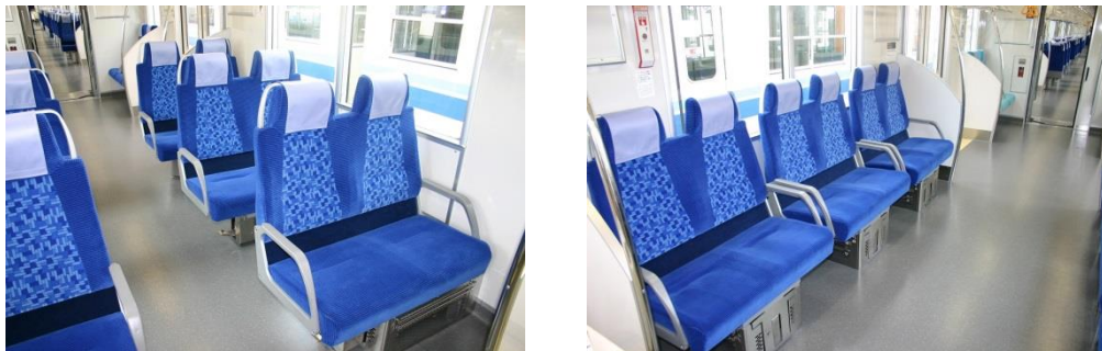
△ 50090 型車両（左：クロスシート、右：ロングシート）

なお、T Jライナーに使用している50090型車両は、クロスシートとロングシートとの転換が可能な「マルチシート」仕様となっており、このような車両の導入は関東では当社が初めてです。