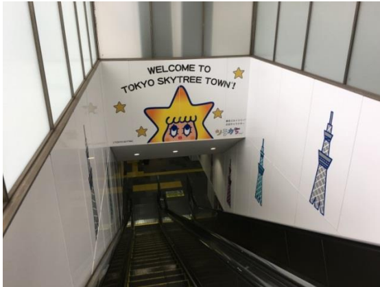
△エスカレーター部分