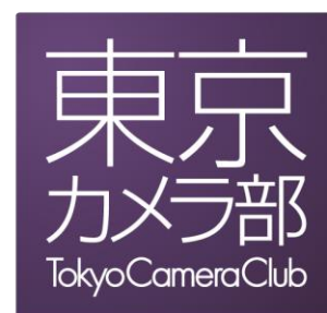
△東京カメラ部 ロゴ