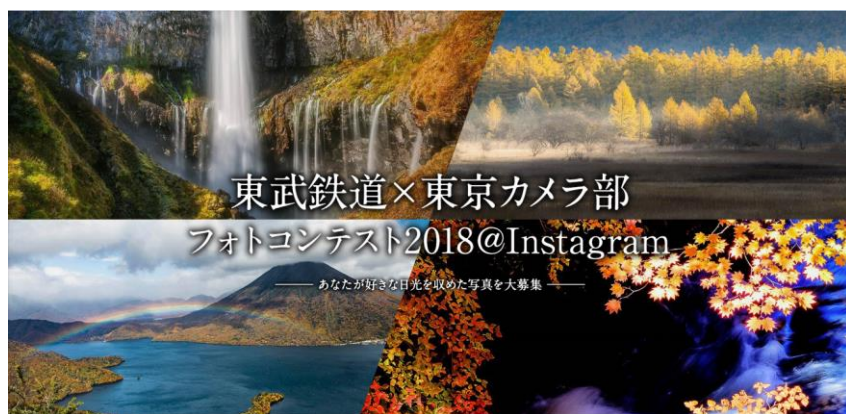
△東京カメラ部 募集ページ（イメージ）