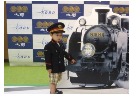
↑ お子さまの制服着用のイメージです