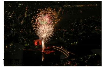
隅田川花火観覧(イメージ)

隅田川花火大会を東京スカイツリー展望台から観覧する特別体験福袋は、ご夫婦の年齢が合計100歳以上の大人のカップル限定です。当日は、東京スカイツリーの構造特別見学をした後、二人だけの貸し切りエレベーターで東京スカイツリー天望デッキへご案内。お出迎えの東京スカイツリー公式キャラクター「ソラカラちゃん」と記念撮影します。その後は地上345mにあるレストラン「Sky Restaurant 634(musashi)」のカウンター席でディナーをお楽しみいただきます。メインイベントは、レストランの観覧スペースや地上450mの天望回廊から隅田川花火大会をご観覧いただきます。花火観覧後は、ゆったりと東武ホテルレバント東京で至福の時間をお過ごしいただけます。