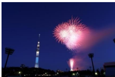
↑東京スカイツリーと隅田川花火(イメージ)