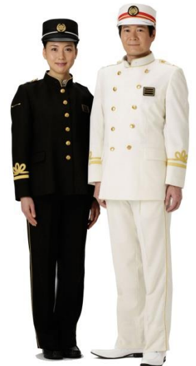
↑ 制服着用のイメージです