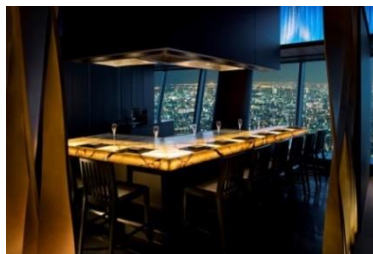
↑天望デッキ「Sky Restaurant 634(musashi)」でディナーを堪能できます(イメージ)