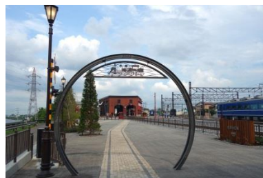
↑ 下今市 転車台広場