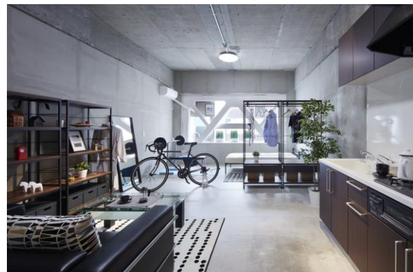
△「ソライエアイル下赤塚」居室（イメージ）