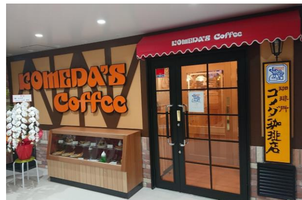
△店舗写真（メガロス24、コメダ珈琲店）