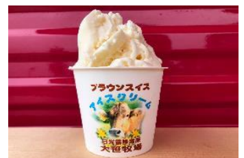
△大笹牧場 特製ジェラート（イメージ）