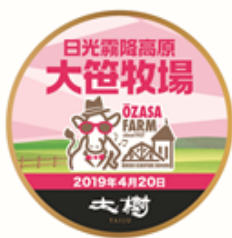
△オリジナルヘッドマーク（イメージ）