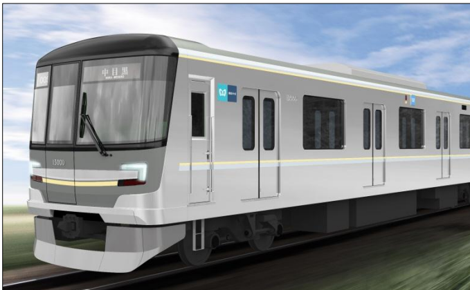
東京メトロ 13000 系