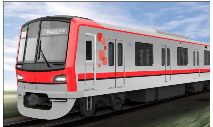
東武鉄道 70000 系