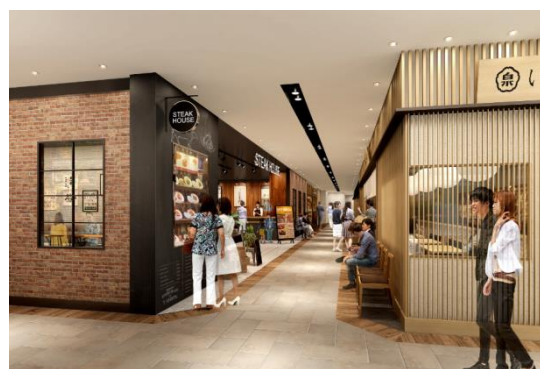
△「新越谷ヴァリエ」4・5階レストランフロア（イメージ）