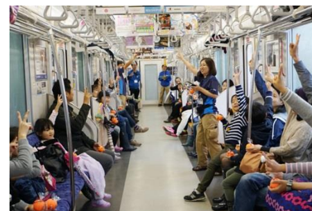
△車内でのイベント(昨年の様子)