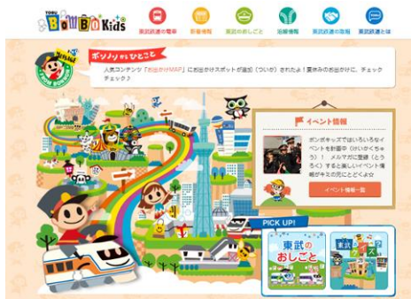
△TOBU BomBo Kids トップページ