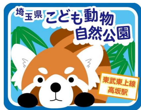
△掲出するヘッドマーク（イメージ）