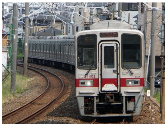
△イベントに使用する車両（30000系）