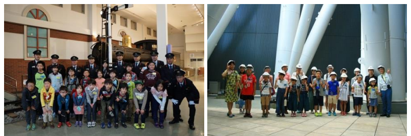
△これまで開催したイベント（例）