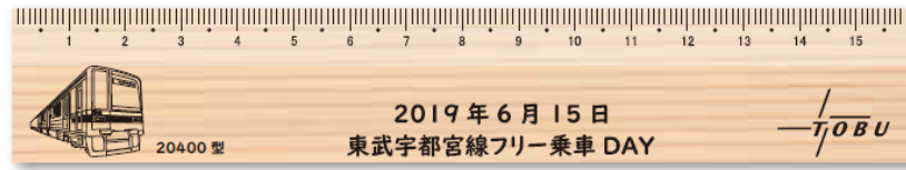
△景品のスケール（イメージ）

また、景品引換場所でお渡しする応募用紙に必要事項を記入のうえ応募いただいた方の中から抽選で当社グループの豪華賞品をプレゼントします。