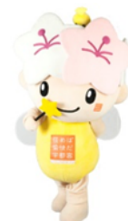
△宇都宮市マスコット キャラクター「ミヤリー」