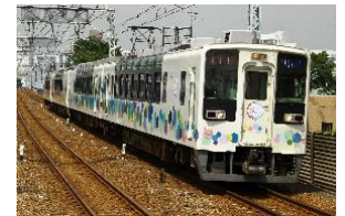
△634型 (スカイツリートレイン)