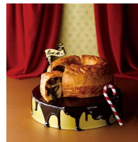
△話題のパン(イメージ)