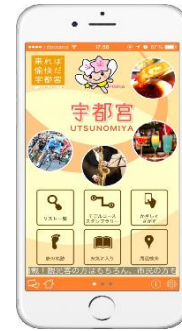
△宇都宮市観光アプリ (イメージ)