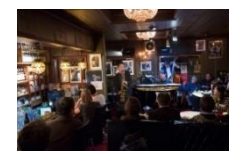
△ジャズコンサートの様子（イメージ）