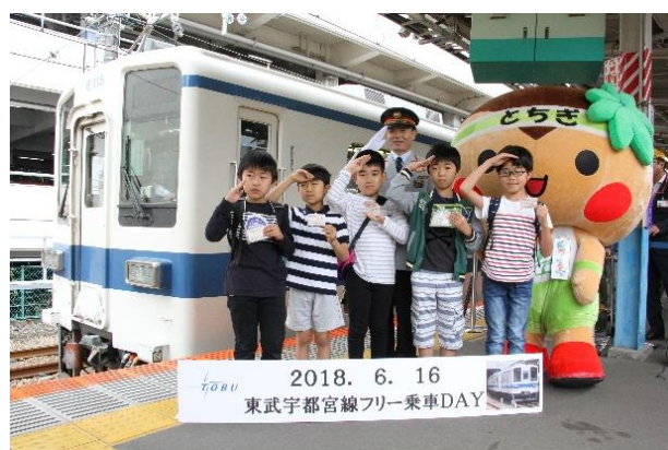
△昨年のフリー乗車DAYの様子