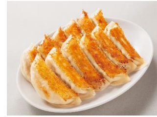
△宇都宮餃子(イメージ)