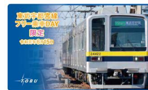
△記念マグネットシート（イメージ）