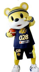
△栃木ブレッक्सマスコット 「ブレッキー」