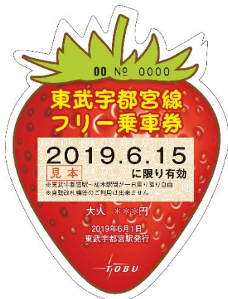
△フリー乗車券（イメージ）