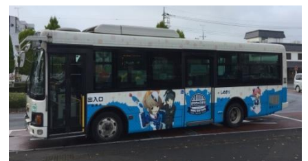
△無料巡回バス（イメージ）