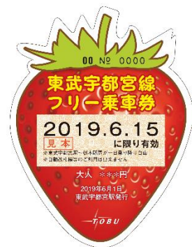
△フリー乗車券（イメージ）