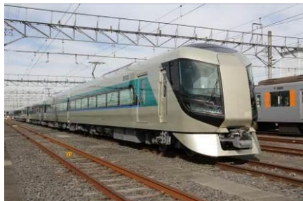
△スカイツリーライナーとして運行する 特急「リパティ」

詳しくは、東武カードのホームページ（ http://www.tobu-card.co.jp/ ）をご参照ください。