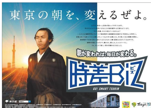
△「時差Biz」広告ポスター