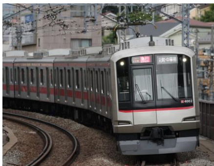
△使用車両（東急電鉄 5050系 4000番台）