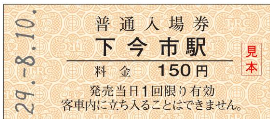
△硬券仕様の入場券（イメージ）

「日光・鬼怒川エリア鉄道乗り放題きっぷ」は、入場券をセットできるよう切り込みが入っており、入場券とあわせてご購入いただくことで、楽しい旅の思い出として残すことができます。