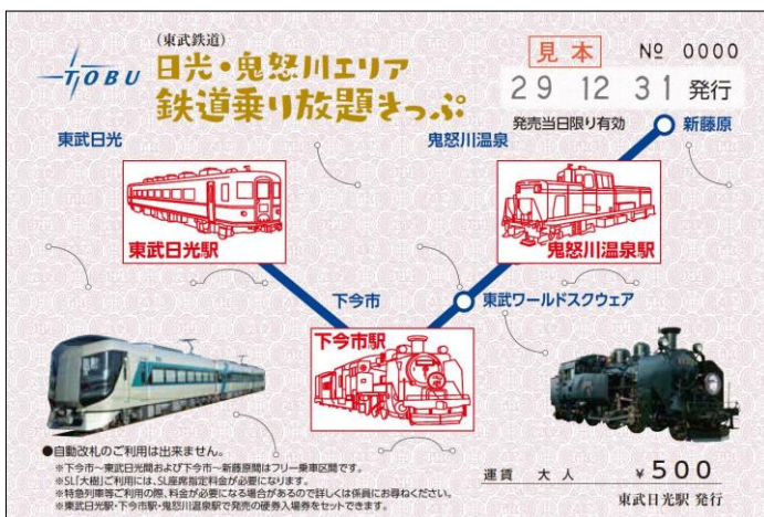
△日光・鬼怒川エリア鉄道乗り放題きっぷ(イメージ)