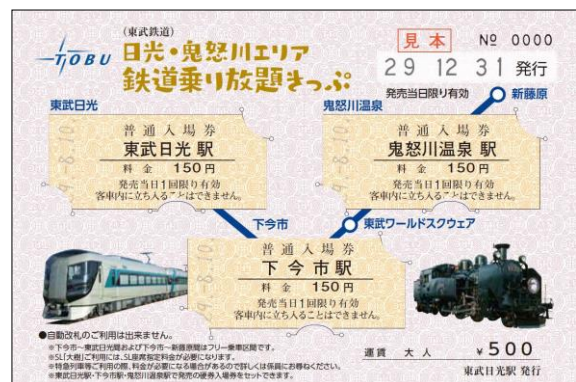
△日光・鬼怒川鉄道乗り放題きっぷへの入場券セットイメージ