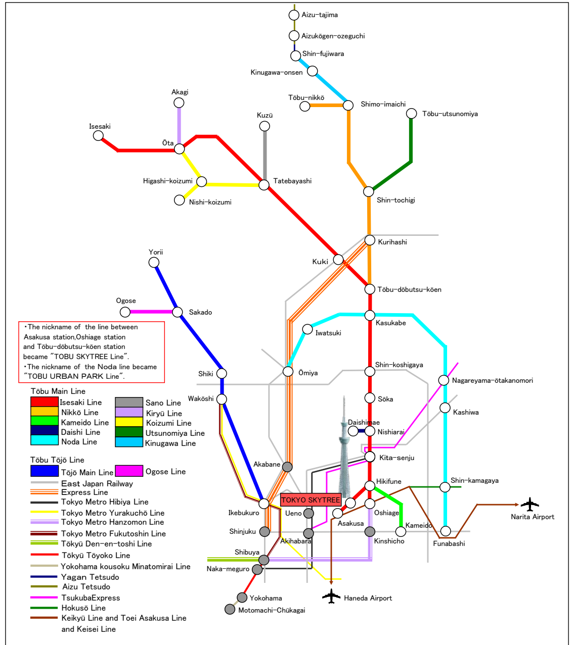
Tōbu Railway Lines (major stations only)