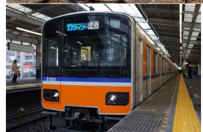
△新型特急車両「リパティ」（左上）、特急「スペーシア」（右上） 特急「りょうもう」号（左下）、座席定員制列車「TJライナー」（右下）