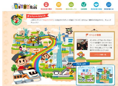
△TOBU BomBo Kids トップページ