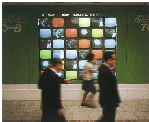
△「マルチスクリーン」(1970年代)