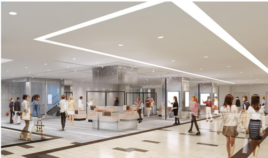
△新設イベントスペース「マルチスクエア」（イメージ）