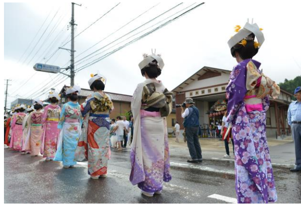
△ 「花嫁行列」(イメージ)