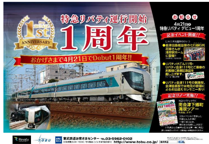
△ 記念ツアーパンフレット (イメージ)