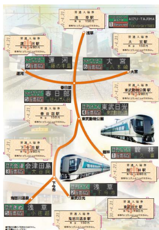
△ 「特急リバティ運行開始1周年記念入場券」（イメージ）