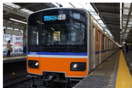
△ TJライナーに使用している 車両「50090型」