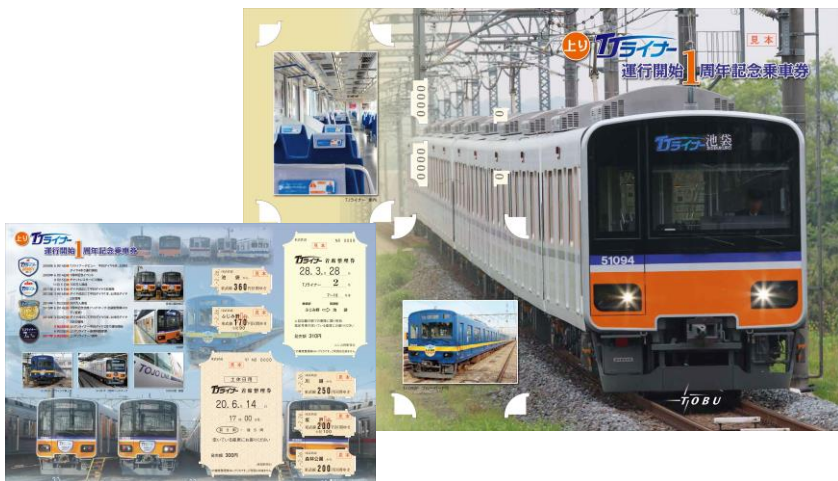
△ 「上りTJライナー運行開始1周年記念乗車券」 台紙イメージ