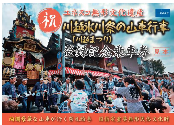
△川越氷川祭の山車行事（川越まつり） ユネスコ無形文化遺産登録記念乗車券 （台紙イメージ）