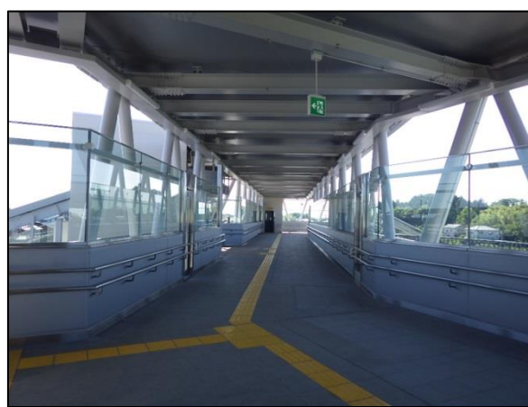
△男衾駅 東西自由通路（内観）