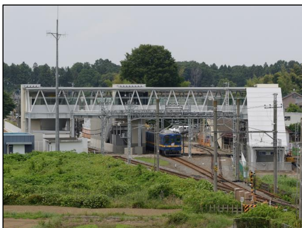
△男衾駅 東西自由通路（外観）