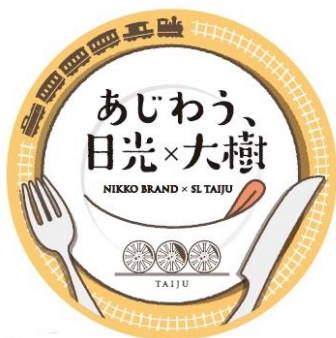
△限定ヘッドマーク（イメージ）