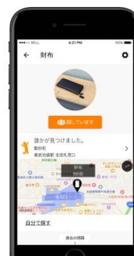
△位置情報通知イメージ