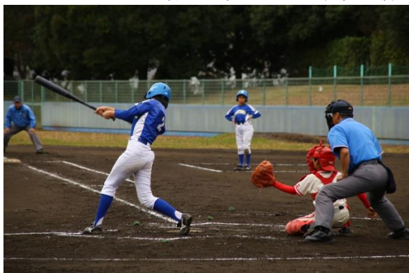
△東武鉄道杯少年野球大会

今後も、鉄道が街と街とをつないでいるように、子どもたちを育む輪を沿線の輪として拡げていき、健やかな子どもたちを育む一助になるよう、一層の活動充実を図ってまいります。