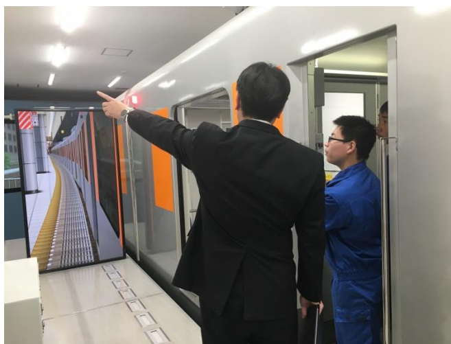
△シミュレータ体験 (イメージ)