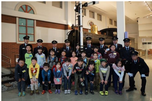
△“東武博物館を貸し切り！電車まるごと勉強会” 参加の子どもたち

2009年3月にオープンした、主に小学生がメインターゲットの参加・体験型のWebサイトです。Web上で、親子で学び、お楽しみいただける様々なコンテンツを展開しているほか、参加者を募集しての体験型イベントも開催するなど、東武グループ各社と連携した“東武グループのキッズポータルサイト”として、多くのお客さまにお楽しみいただいています。