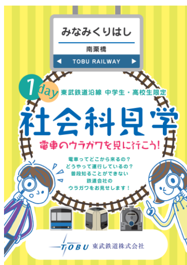
△社会科見学パンフレット