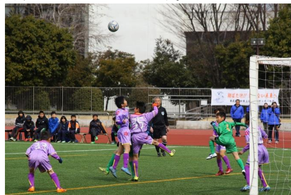
△東武鉄道杯少年サッカー大会