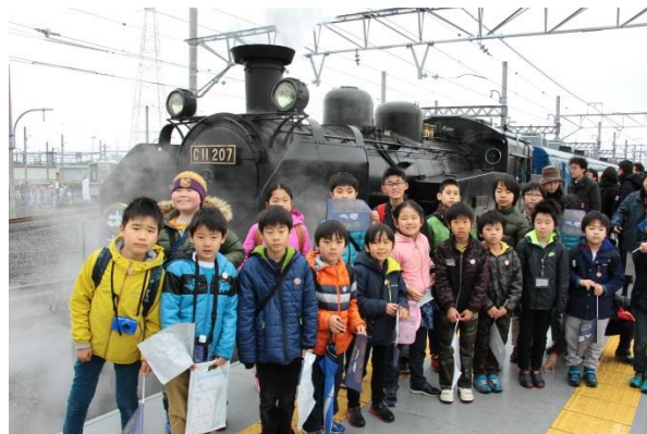
△“SL大樹を知ろう！乗ってみよう” 参加の子どもたち