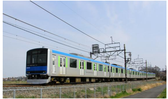
△新型車両 60000系 ※急行列車は60000系車両以外でも運転します

【土休日】7時台～8時台大宮方面行き2本、 9時台～20時台に大宮方面行き・柏方面行き各2本/時(約30分間隔) 1日あたり50本(大宮方面行き26本、柏方面行き24本)