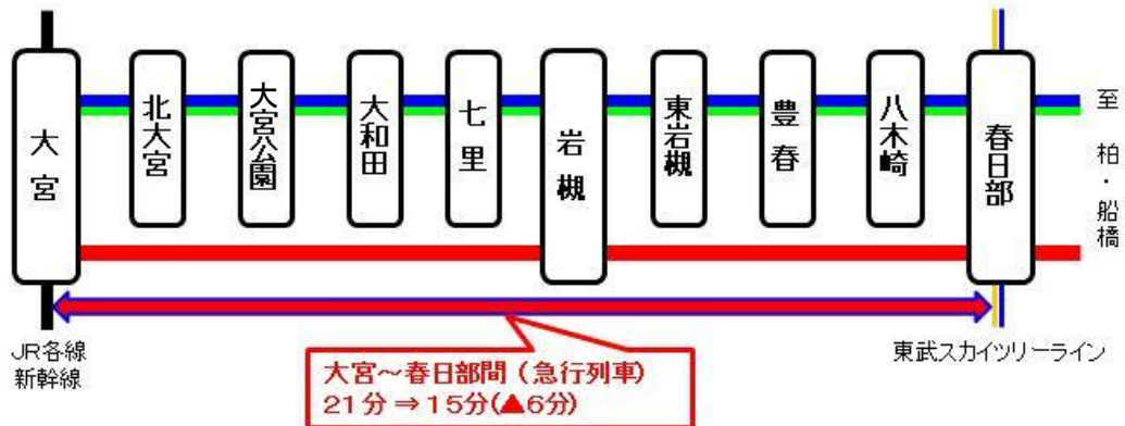
△急行列車の運転略図