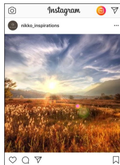
▲Instagram トップページ（イメージ）