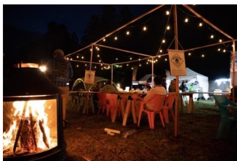
△ 「Nikko Beer Garden」会場（イメージ）