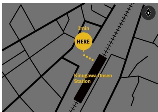
△「Nikko Beer Garden×SL大樹 in Kinugawa」アクセスマップ

※未成年のお客さまや、車の運転などによりお酒が飲めないお客さまには同券を「ソフトドリンク一杯無料券」としてご利用いただけます。