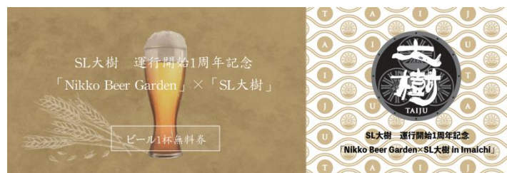
△「Nikko Beer Garden×SL大樹 in Imaichi」ビール一杯無料券(イメージ)