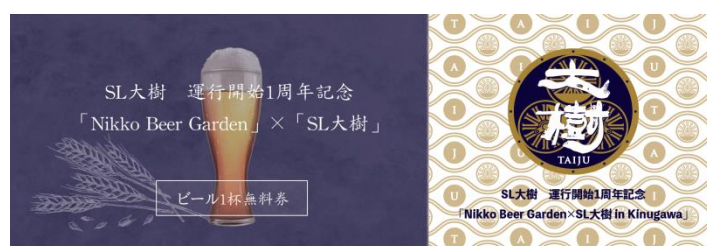
△「Nikko Beer Garden×SL大樹 in Kinugawa」ビール一杯無料券(イメージ)