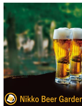
△ 「Nikko Beer Garden」（メインビジュアル）