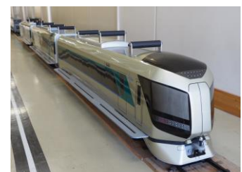
△ミニリバティ (イメージ)