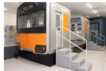
△運転シミュレータ