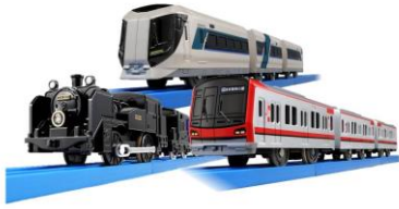
△SL 大樹, リバティ, 70000系 プラレール