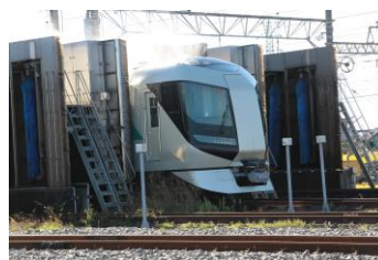
△車両洗浄線を走る電車 体験乗車