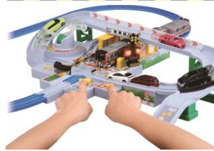
△新商品大型踏切体験会