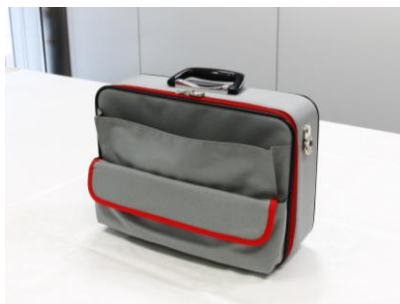
△ 東武鉄道運転士用カバン 〔レプリカ〕 「70000系デザイン」仕様 限定20個・20,000円（税込み） シリアルナンバー入り

東武鉄道運転士用カバン〔レプリカ〕「70000系デザイン」仕様を限定販売するほか、東武ファンフェスタの開催を記念した会場限定の各種鉄道グッズおよび鉄道各社の各種関連グッズなどを販売します。