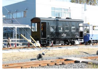
△車掌車[ヨ5000形]の体験乗車