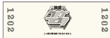
△記念乗車証 (D型硬券)