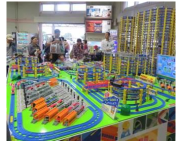
△巨大ジオラマ (イメージ)