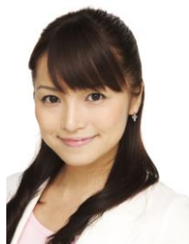
△久野知美アナウンサー