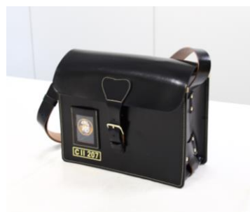
△ 東武鉄道機関士用カバン 〔レプリカ〕 「黒色革製」仕様 限定20個・30,000円（税込み） シリアルナンバー入り

※上記商品については、会場にてお一人様1つの商品につき1枚の整理券を配付します。 ※ジャンク品の販売は行いません。