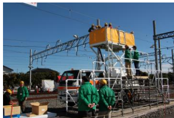
△軌陸両用型架線作業車