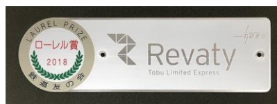
△500系ローレル賞受賞記念プレート