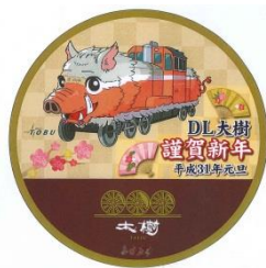
△正月限定ヘッドマーク （イメージ）

※「猪倉山 東光院 泉福寺」…日光市猪倉に所在。815（弘仁6）年弘法大師空海上人が薬師如来を刻し草庵を結び、東光院と名付けたのを開創としている。現在の本堂は1975（昭和50）年に建立されたもので、本尊胎蔵界大日如来、弘法大師、興教大師、理源大師、阿弥陀如来、地藏菩薩をお祀りしている。