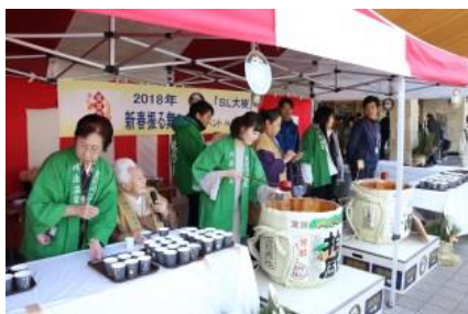
△昨年の振る舞い酒の様子