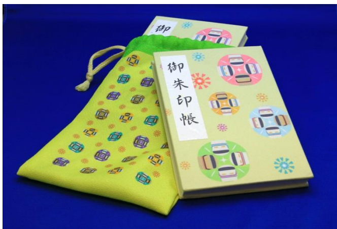
△「オリジナル御朱印帳」と「オリジナル御朱印帳袋」