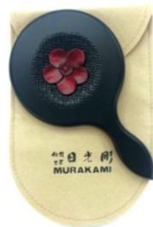
△「オリジナル匂い袋」(左)と「オリジナル日光彫手鏡」(右)