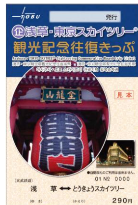
△「浅草・東京スカイツリー®観光記念往復きっぷ」イメージ (左：表面、右：裏面)