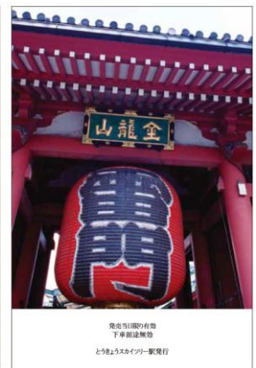
△浅草駅販売デザイン（イメージ） （左：表面、右：裏面）