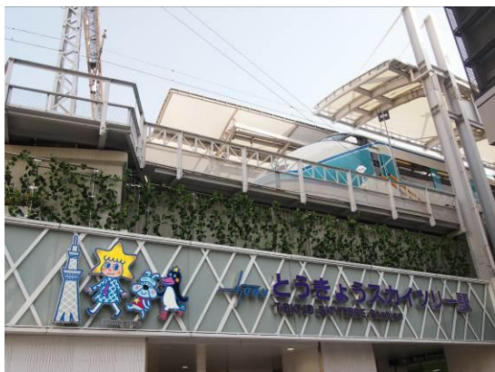
△とうきょうスカイツリー駅と特急スペース

まもなく開業2周年を迎える東京スカイツリータウンを観光したあとは、日本有数の観光地である浅草へのおでかけに、ぜひ東武スカイツリーラインをご利用ください。概要は別紙の通りです。