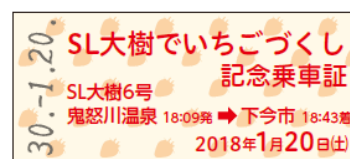
△SL「大樹」6号硬券仕様特製記念乗車証

※記念乗車証と硬券仕様特製記念乗車証は座席数分しかございませんので、座席を指定したSL座席指定券をお買い求めいただいたお客さまを対象とさせていただきます。