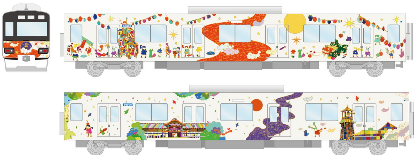
△「池袋・川越アートトレイン」（イメージ）