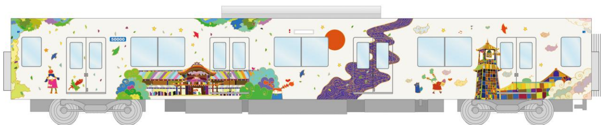
△(8号車)時の鐘と川越城本丸御殿