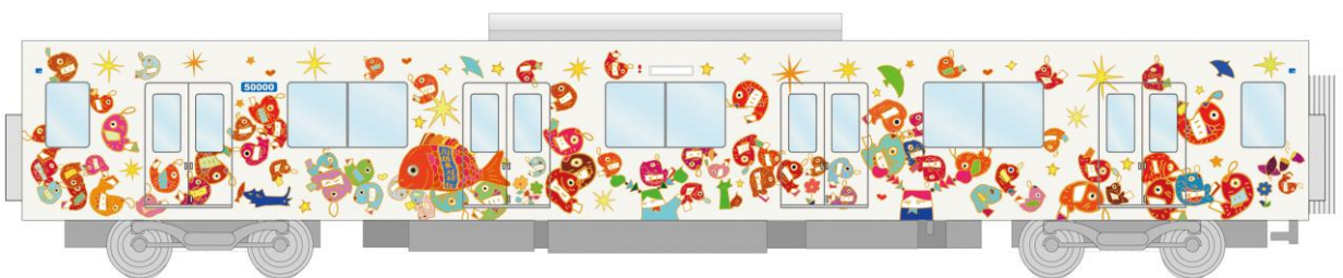
△（2号車）あい鯛みくじ