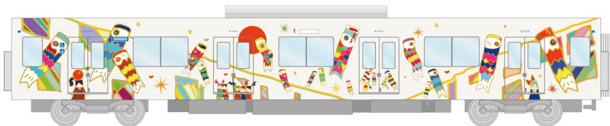
△(9号車)大正浪漫夢通りの鯉のぼり