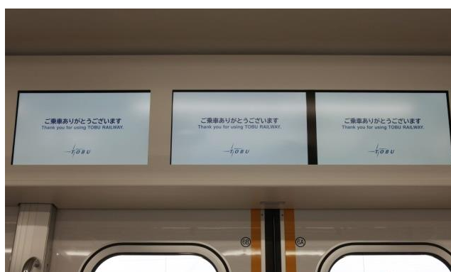
△車内情報案内表示器