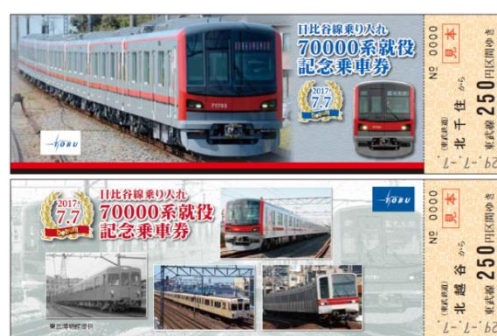
△70000系就役記念乗車券

※7月7日（金）の70000系の運転に使用する電力（約3000kwh）は全てバイオマス発電によるグリーン電力で賄います。