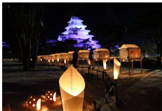
平成30年 第19回の様子(イメージ)