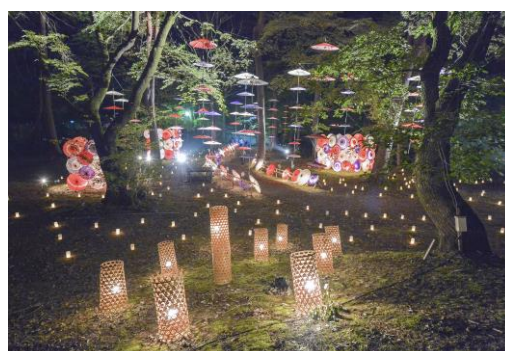
平成30年 第9章の様子(イメージ)