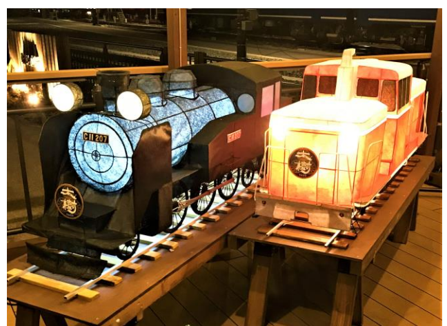
△SL大樹のシンボル展示（イメージ）