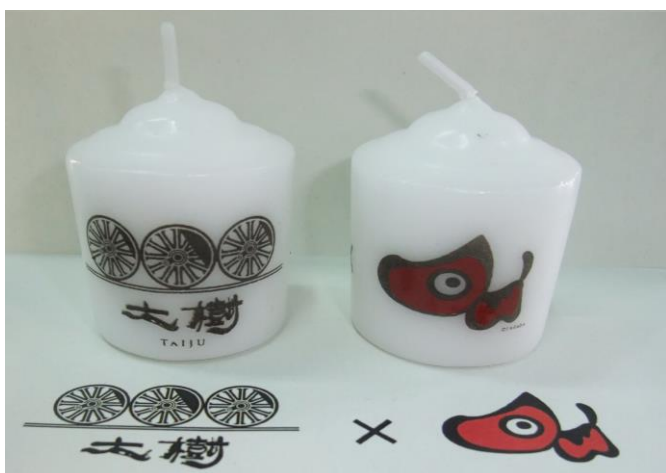
△SL大樹×あかべえ絵ろうそく（イメージ）

今後も沿線地域と連携した取り組みを実施することで、「日光・鬼怒川エリアの活性化」に努めるとともに、「東北復興支援の一助」を推進してまいります。