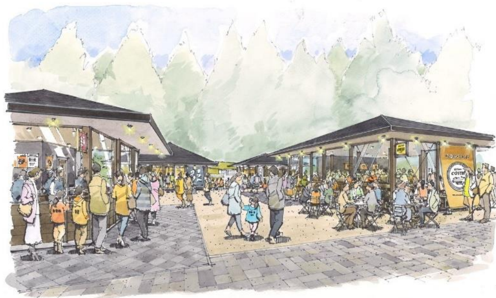
△「西参道茶屋」(イメージ)